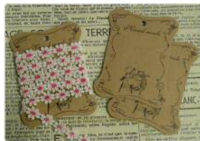
③ ソーイングレディ