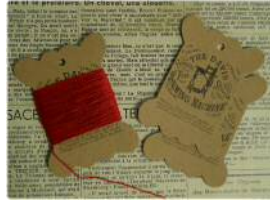
① ソーイングマシン