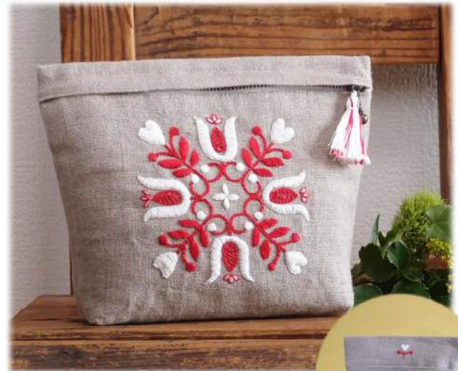
『チューリップのポーチ』